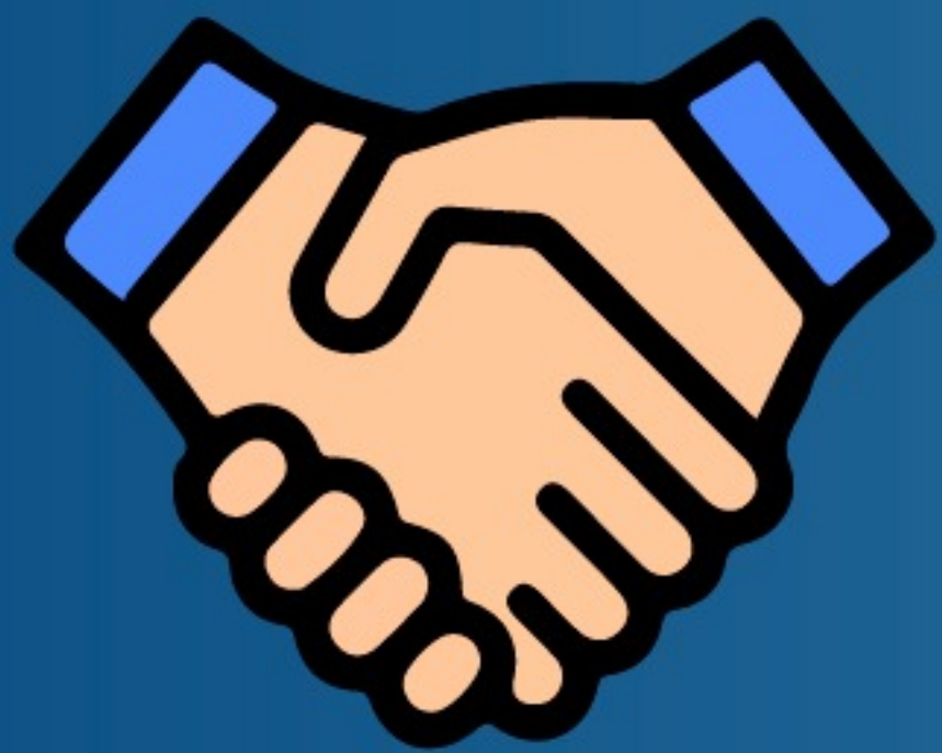
Apretón de manos